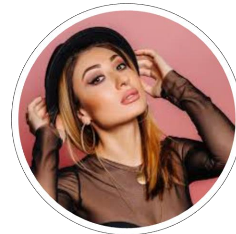
Автор и исполнитель песен Маргарита Позоян